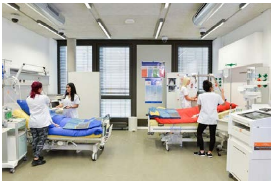
Studierende im „Skills Lab“ der Fachhochschule Bielefeld