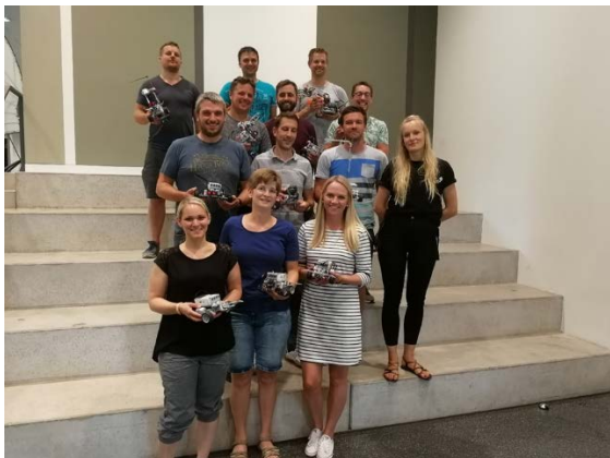
teilnehmende Lehrerinnen und Lehrer mit EV3 Robotern

Am 01.07.2019 war es wieder einmal so weit. Das Schüler*innenlabor experiMINT empfing ausnahmsweise keine Schüler*innen, sondern Lehrer*innen. Genau genommen besuchten uns 16 Lehrkräfte aller Schulformen mit Sek I, die Technik fachfremd unterrichten oder im Schuljahr 2018/19 unterrichten werden. Manuel Mai, wissenschaftlicher Mitarbeiter im Schüler*innenlabor, organisierte einen bunten Experimentiertag - erstmalig rund um Lego Mindstorms. Die teilnehmenden Lehrer*innen bauten ihren ersten eigenen Roboter, der unterschiedliche Aufgaben zu erledigen hatte. Das Schüler*innenlabor unterstützt so jedes Jahr den Zertifikatskurs „Technik S1“ mit einer Unterrichtseinheit.