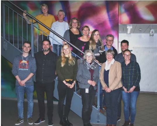
(Auftrittreffen der Projektbeteiligten für das neue Kooperationsprojekt zwischen der FH Bielefeld und der Universität Bielefeld.)

Innerhalb des neuen EFRE-geförderten Projektes „Interprofessionell von Anfang an: Biologie – Technik – Gesundheit“ entstehen im nächsten Jahr neue Experimentierangebote für Schüler*innen ab der 8. Klasse. Eine Besonderheit des neuen Angebots ist die interdisziplinäre Zusammenarbeit zwischen Ingenieur*innen und Pflegewissenschaftler*innen. In 2020 wird zusammen mit dem Fachbereich Wirtschaft und Gesundheit ein neuer Workshop zum Thema „3D-Druck von Prothesen und Orthesen“ konzipiert, der im Frühjahr 2020 erstmalig erprobt wird. Nicht nur innerhalb der Fachhochschule Bielefeld wird das Schüler*innenlabor seine Fühler aus-