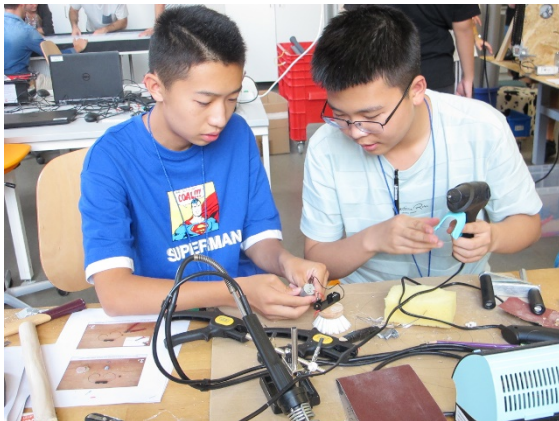
Jugendliche löten einen Putzroboter, um ihn in die Kettenreaktionsmaschine zu integrieren

Türkei drei Tage an einer Kettenreaktionsmaschine.