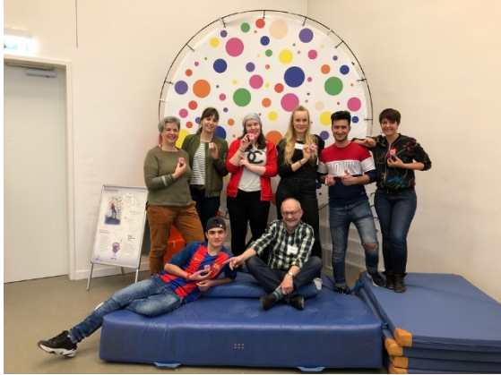
Teilnehmerinnen und Teilnehmer des Lötworkshops vor der Umfallmaschine

Endlich „angekommen“ im experiMINT Schülerinnen*labor der FH Bielefeld. Auch in diesem Jahr veranstaltete das Schüler*innenlabor wieder einen exklusiven Experimentierworkshop für die jungen Geflüchteten des Projekts „angekommen in deiner Stadt Bielefeld“. Die Walter Blüchert Stiftung fördert gemeinsam mit dem Schulministerium des Landes Nordrhein-Westfalen und der Stadt Bielefeld das Projekt „angekommen in deiner Stadt Bielefeld“. Als Ergänzung zum Unterricht der Berufskollegs erhalten die jungen Menschen nachmittags sowie in Ferienzeiten zusätzliche Angebote. Im Rahmen des Angebots „Bielefeld entdecken“ lernten die jungen Menschen am 14.02. das Schüler*innenlabor im Fachbereich Ingenieurwissenschaften und Mathematik kennen. Da der Termin dieses Jahr auf den Valentinstag fiel, lief alles unter dem Motto der Liebe. Liebe und Ingenieurwissenschaften?! Ja – das geht. In dem zweistündigen Workshop, in dem der Schwerpunkt auf dem Thema Elektronik lag, bauten die Teilnehmer und Teilnehmerinnen ein blinkendes LED-Herz! „Hierzu mussten sie verschiedene Widerstände, Kondensatoren, Transistoren und LEDs auf eine Platine löten und lernten so