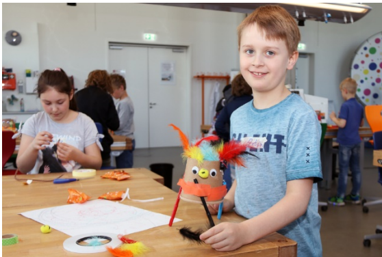
Teilnehmer baut einen Malroboter

Ostern im experiMINT Schüler*innenlabor – auch zur Ferienzeit war wieder einiges los im Labor des Fachbereichs Ingenieurwissenschaften und Mathematik.